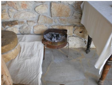
Το κρητικό λαϊκό σπίτι

Τέλος στο πίσω μέρος του σπιτιού συναντούσε κανείς το μαγκάλι που το χρησιμοποιούσαν ως εστία θέρμανσης και το βολόσυρο (δύο πέτρες η μια πάνω στην άλλη) για να αλέθουν το σιτάρι για την παρασκευή του ψωμιού.